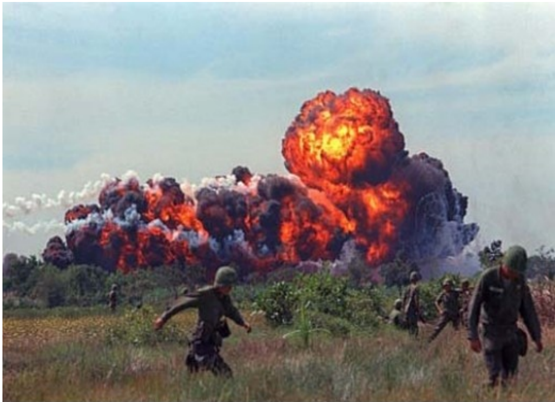
Βιετνάμ : έκρηξη βόμβας Ναπάλμ