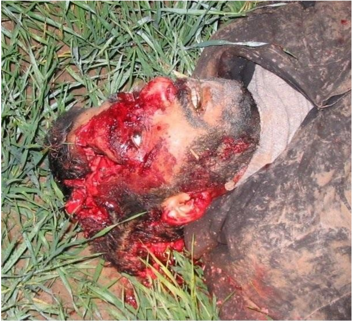
Ιρακινός νεκρός από πυροβολισμό στο κεφάλι