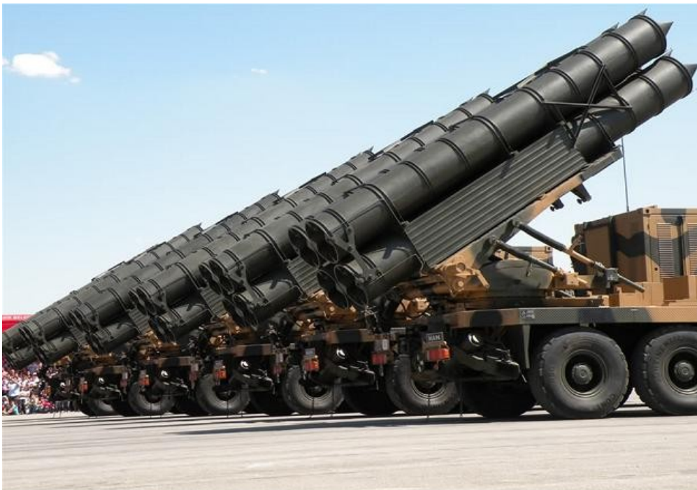
Επίδειξη πυραυλικών συστοιχιών