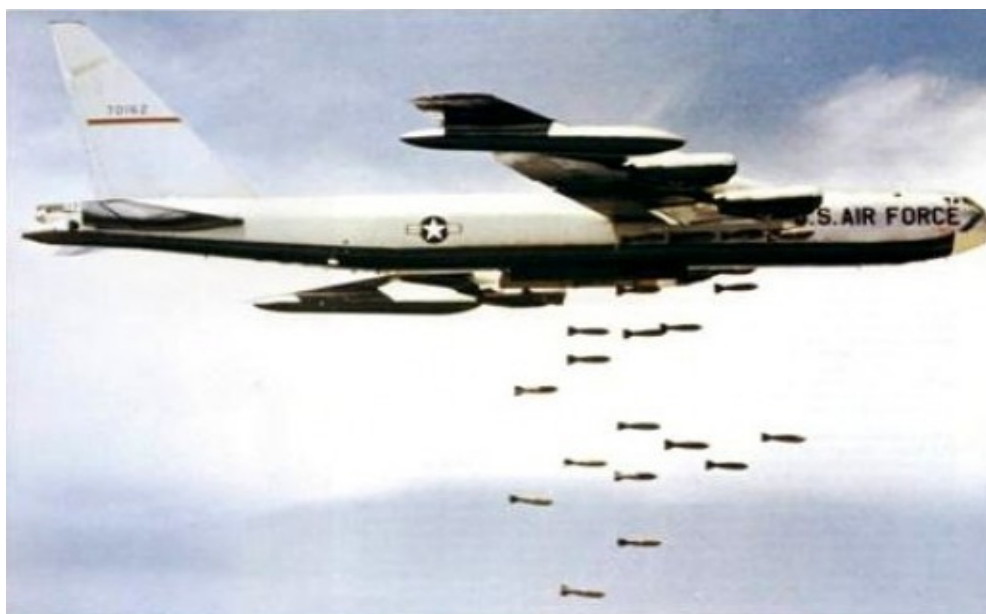
Βιετνάμ : βομβαρδιστικό την ώρα της δράσης

Εδώ βλέπουμε τις συνέπειες της πρακτικής εφαρμογής των μιλιταριστικών « αξιών ». Καμαρώστε!