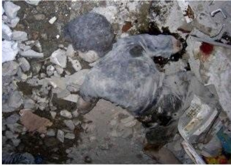
Ιράκ : νεκρό παιδί στα ερείπια μετά από βομβαρδισμό