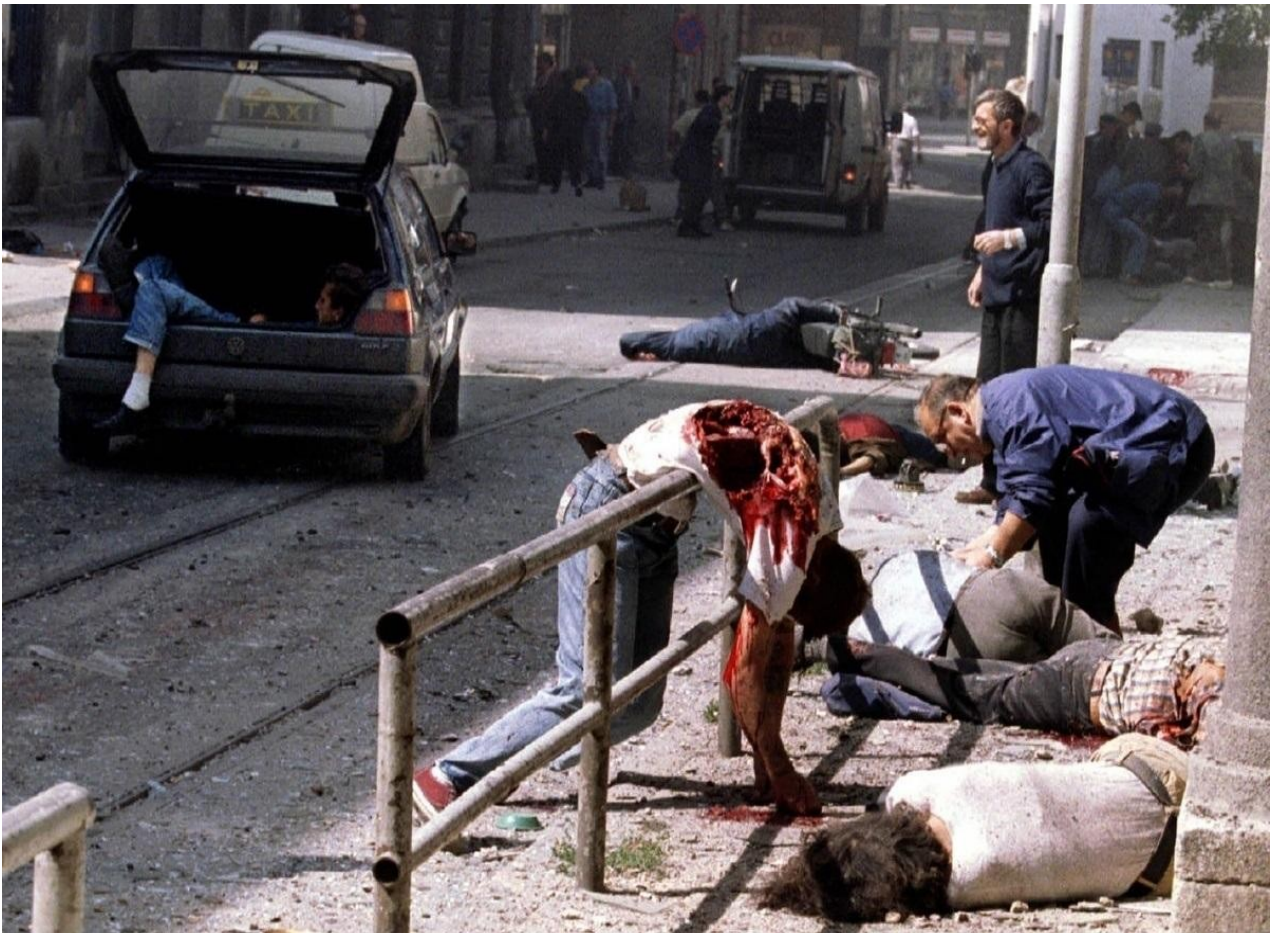
Γιουγκοσλαβία : μακελειό στην αγορά του Σαράγεβο έπειτα από επίθεση με βλήματα