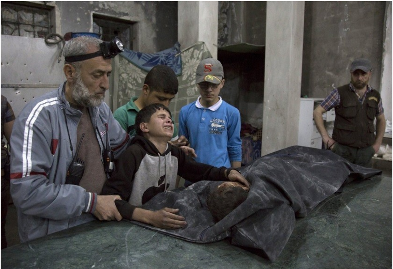
Συρία : αγόρι κλαίει για το χαμό μέλους της οικογένειάς του