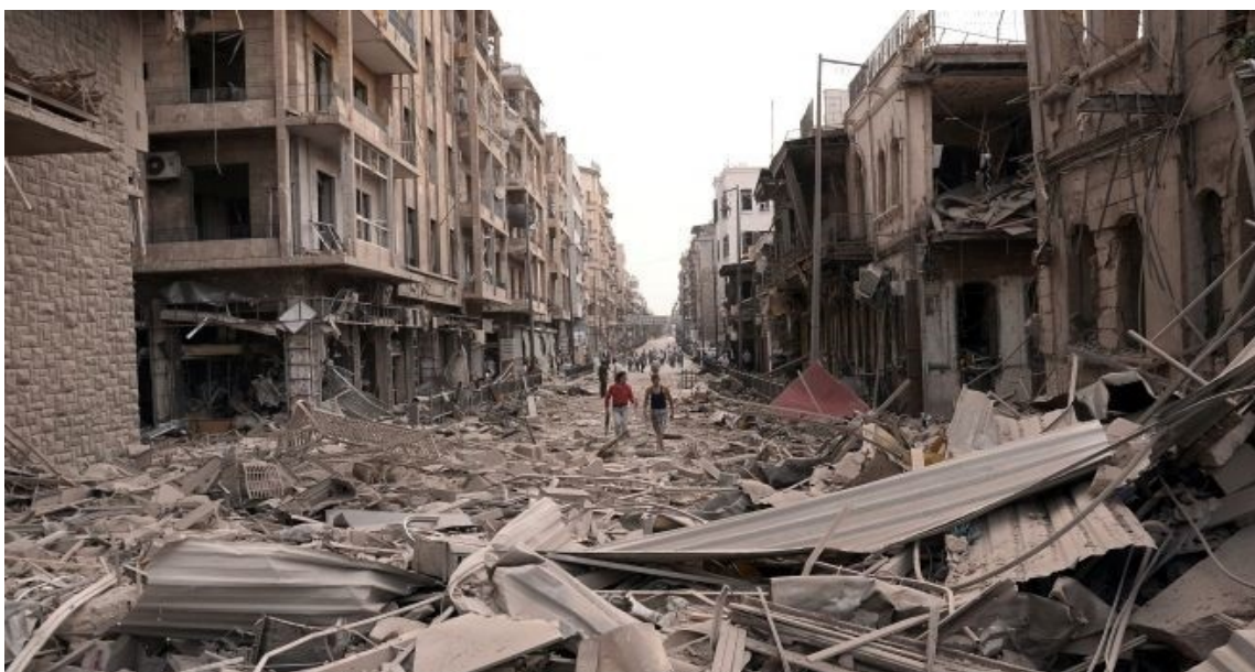
Συρία : πόλη μετά τους βομβαρδισμούς