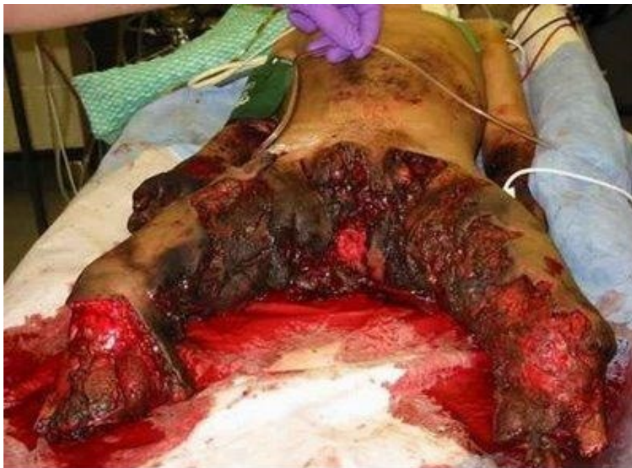
Τι γίνεται όταν πατάς σε νάρκη ...