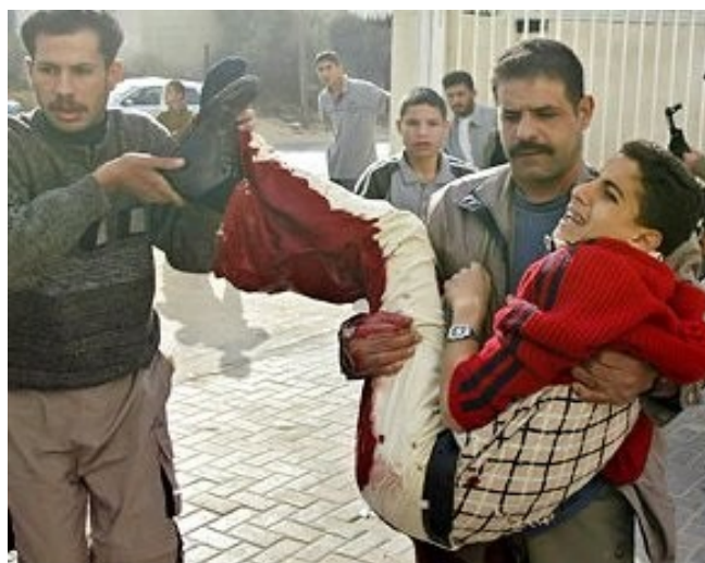
Ιράκ : τραυματισμένο παιδί