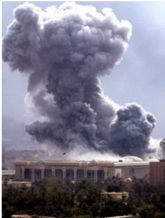
Βομβαρδισμός στο Ιράκ