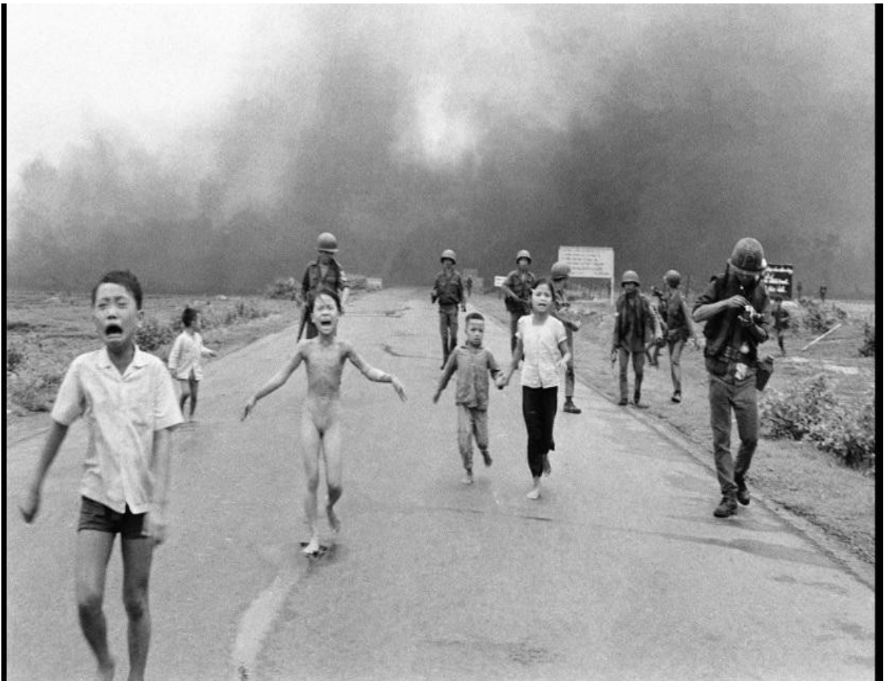
Βιετνάμ : τρομαγμένα παιδιά τρέχουν για να σωθούν μετά από έκρηξη Ναπάλμ

Ορίστε ποια είναι η τύχη που περιμένει τα παιδιά σε καιρό πολέμου. Δείτε αν αντέχετε!