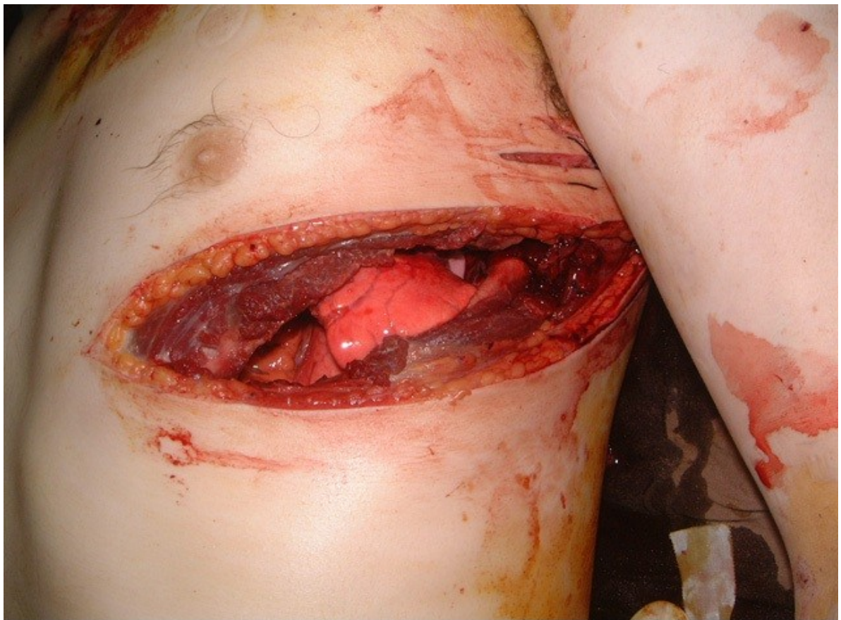
Ιράκ : ξεκοιλιασμένος νεκρός μισθοφόρος