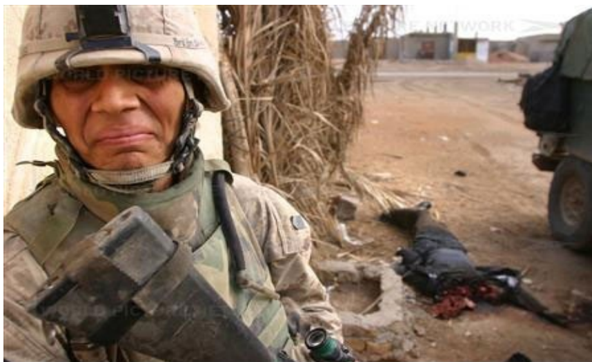
Ιράκ : αηδιασμένος πεζοναύτης δίπλα σε πτώμα Ιρακινού που σαπίζει