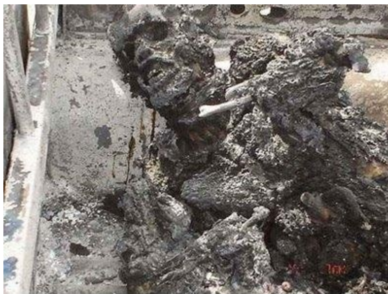
Ιράκ : θύμα εκρηκτικού μηχανισμού