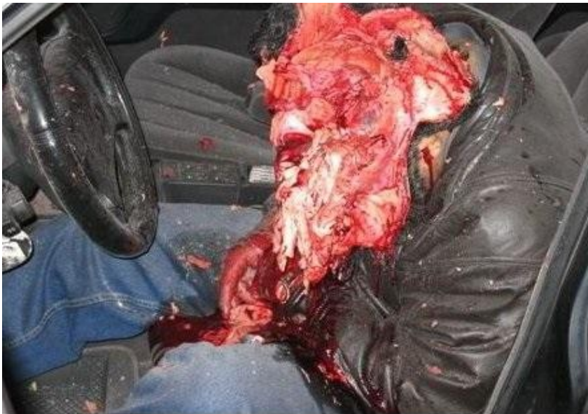
Ιρακινός νεκρός έπειτα από πυροβολισμό σε σημείο ελέγχου