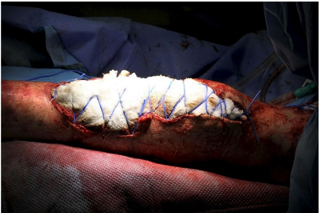
Σοβαρό τραύμα που υπέστη μισθοφόρος στο Αφγανιστάν.