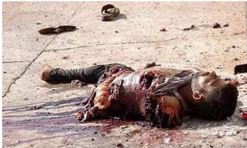
Ιράκ : κομματιασμένο πτώμα στο δρόμο