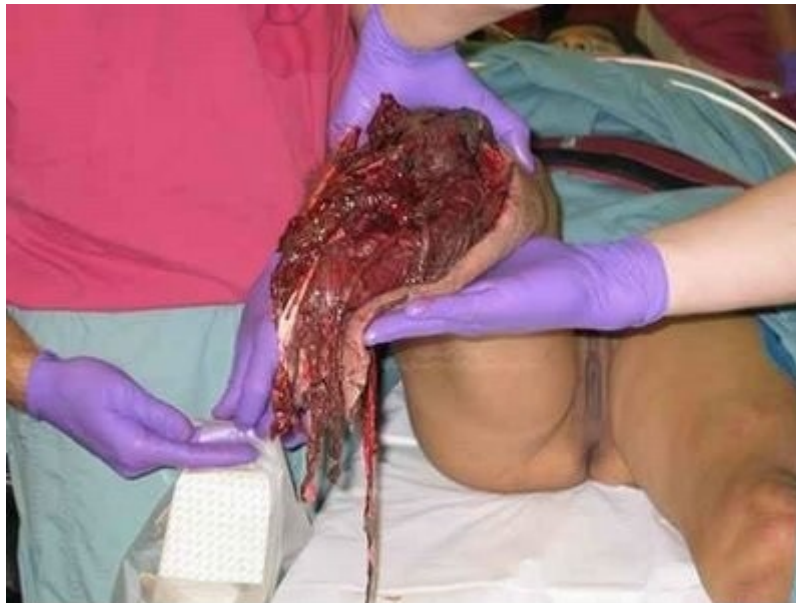
Ακρωτηριασμός από έκρηξη νάρκης