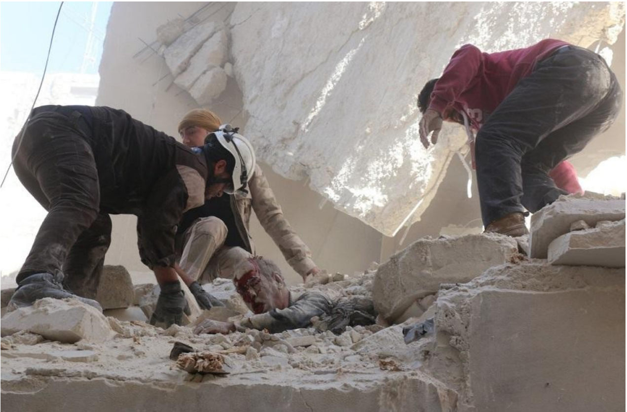
Συρία : απεγκλωβισμός τραυματία μετά από βομβαρδισμό

Τι το ηρωικό υπάρχει στο να εγκλωβίζεις τον κόσμο μέσα σε εμπόλεμες ζώνες όπου αν κάποιος δε χάσει τη ζωή του από τις εχθροπραξίες θα βρεθεί αντιμέτωπος με την πείνα, τη δίψα, τις μολυσματικές ασθένειες;