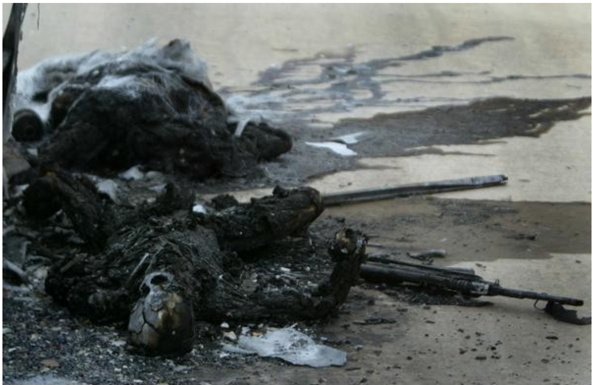
Ιράκ : απανθρακωμένο πτώμα στρατιώτη