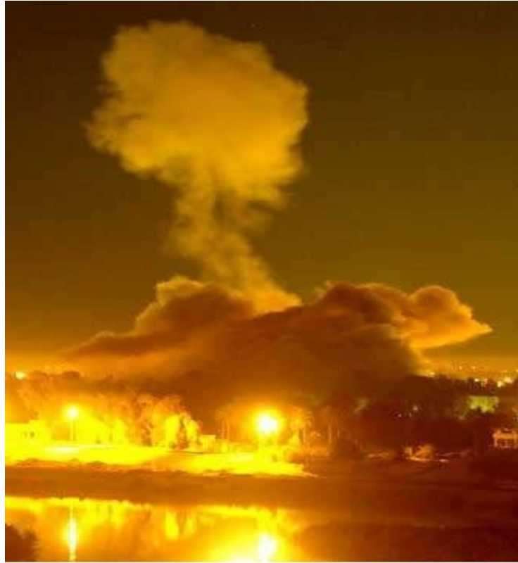
Βομβαρδισμός στο Ιράκ

Από που κι ως που είναι ήρωες και προστάτες του λαού αυτοί που βομβαρδίζουν αδιακρίτως ισοπεδώνοντας πόλεις και χωριά, αυτοί που επιτίθενται σε άμαχους ( ακόμα και μέσα σε σχολεία ή νοσοκομεία ) αφήνοντας πίσω χιλιάδες νεκρούς, τραυματίες και ακρωτηριασμένους;