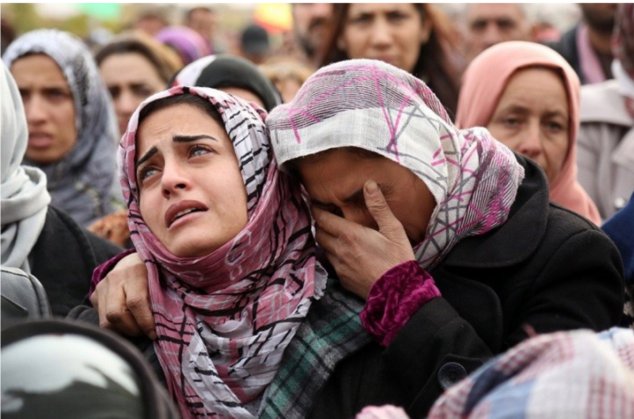
Συρία : θρήνος για το χαμό αγαπημένων προσώπων