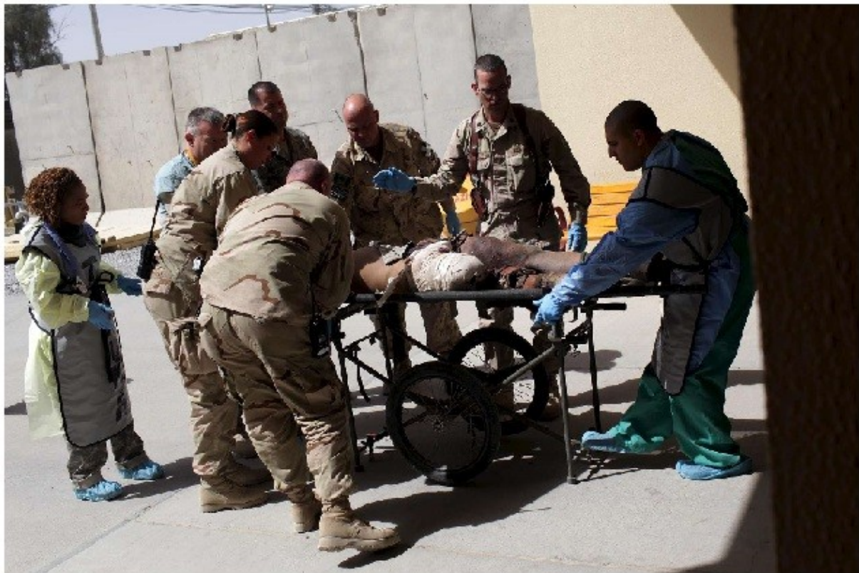
Μισθοφόροι νεκροί και βαριά τραυματισμένοι στο Αφγανιστάν.