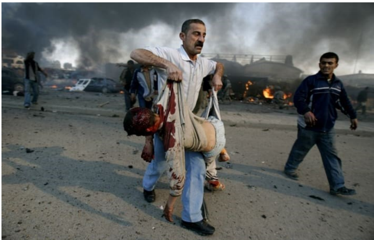
Ιράκ : θύμα του πολέμου