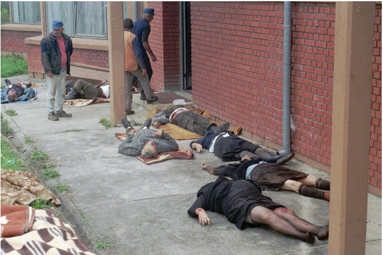
Γιουγκοσλαβία : άμαχοι νεκροί