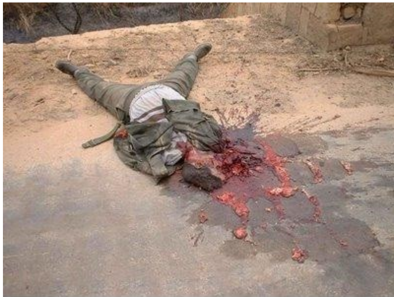
Ιράκ : σκοτωμένος στρατιώτης