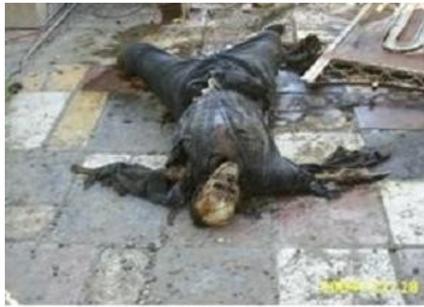
Ιράκ : πτώμα σαπίζει άταφο