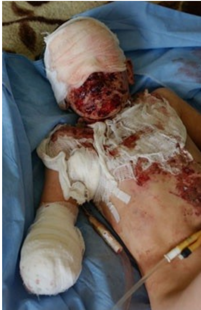
Ιράκ : παιδί βαρύτατα τραυματισμένο