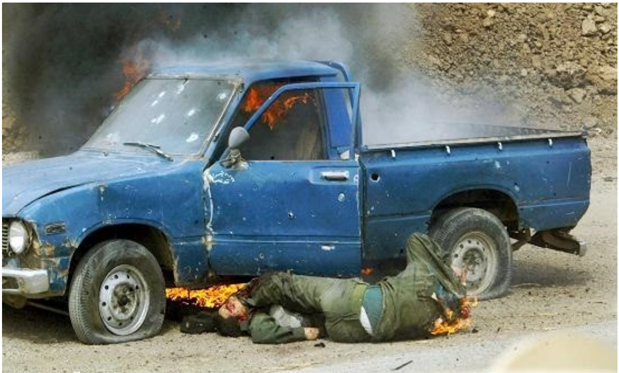
Ιράκ : θάνατος στο πεδίο της μάχης