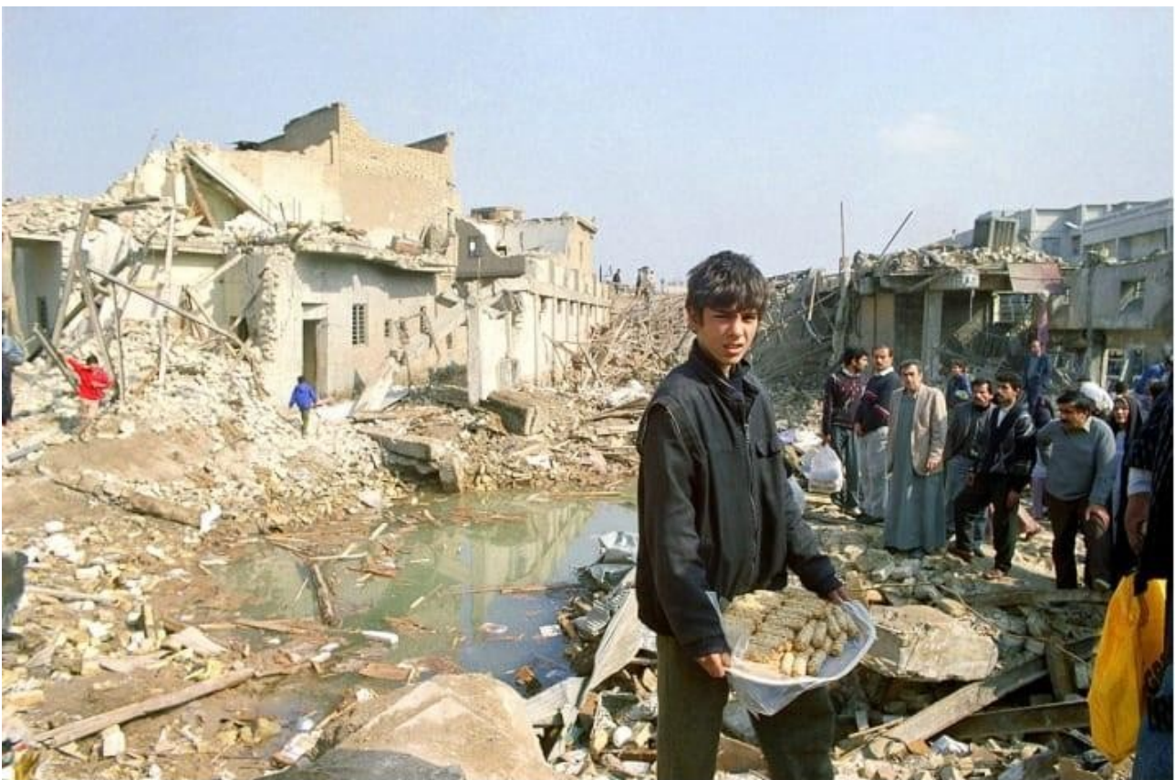
Ιράκ : πόλη μετά από βομβαρδισμό