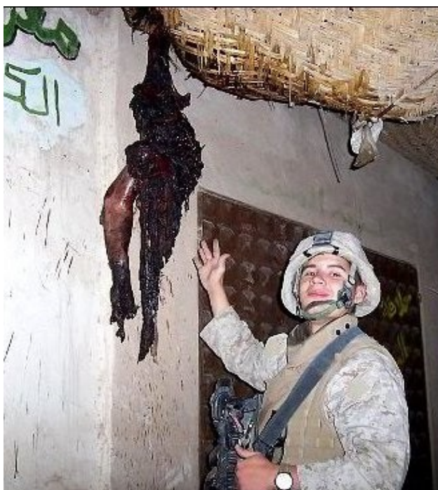
Ιράκ : πεζοναύτης δείχνει το κομμένο χέρι ενός Ιρακινού

Πάρτε το χαμπάρι. Δεν υπάρχει καμία τιμή στο να αποτελεις τμήμα του δολοφονικού μηχανισμού του στρατού και καμία αξία δεν παίζει εκεί μέσα πέρα από το χρήμα. Αξίζει άραγε να κατακτήσεις παλιάνθρωπος μόνο και μόνο για να έχεις ένα σταθερό μισθό; Όταν υπηρετείς ένα μηχανισμό που δε σέβεται την ανθρώπινη ζωή τότε εσύ ο ίδιος υποτιμάς τον εαυτό σου και κάνεις τη ζωή σου ανάξια λόγου. Στο περιβάλλον του στρατού μπορείς να συναντήσεις συγκεντρωμένο στο μέγιστο βαθμό ό,τι πιο σάπιο έχει βγάλει η κοινωνία. Εξουσιομανείς, φιλοπόλεμοι, ψυχικά άρρωστοι, σαδιστές και θερμόαιμοι ανεγκέφαλοι βρίσκουν μέσα στις τάξεις του στρατού ένα καταφύγιο. Μια ζεστή φωλιά όπου μπορούν να εκφράζουν ελεύθερα τις ανώμαλες ορέξεις τους και να τις κάνουν πράξη κάθε φορά που παίρνουν μέρος σε πολεμικές επιχειρήσεις. Ο στρατός – κι ακόμα περισσότερο ο μισθοφορικός στρατός – προσελκύει κακοποιά στοιχεία και υπάνθρωπους καθώς τους δίνει τη δυνατότητα να καταστρέφουν, να βασανίζουν, να βιάζουν και να σκοτώνουν ατιμώρητα κι επιπλέον να ανταμείβονται γι' αυτό. Θες να περάσεις τη ζωή σου σε ένα τέτοιο περιβάλλον παρέα με τέτοια άτομα;