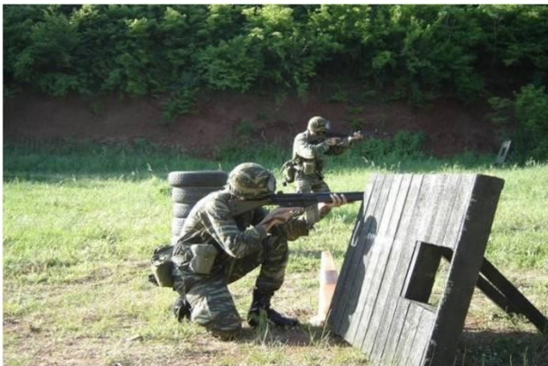
Άσκηση σε πεδίο βολών