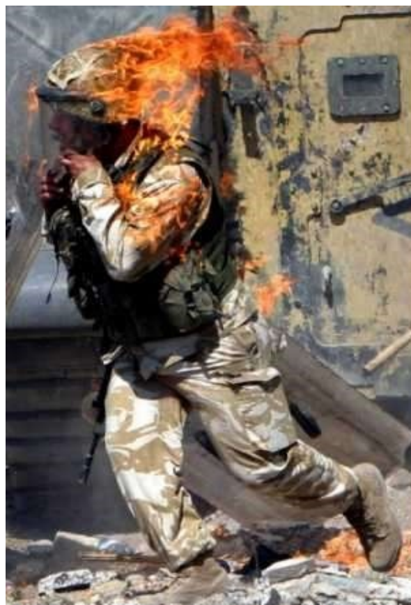
Ιράκ : μισθοφόρος τυλίγεται στις φλόγες