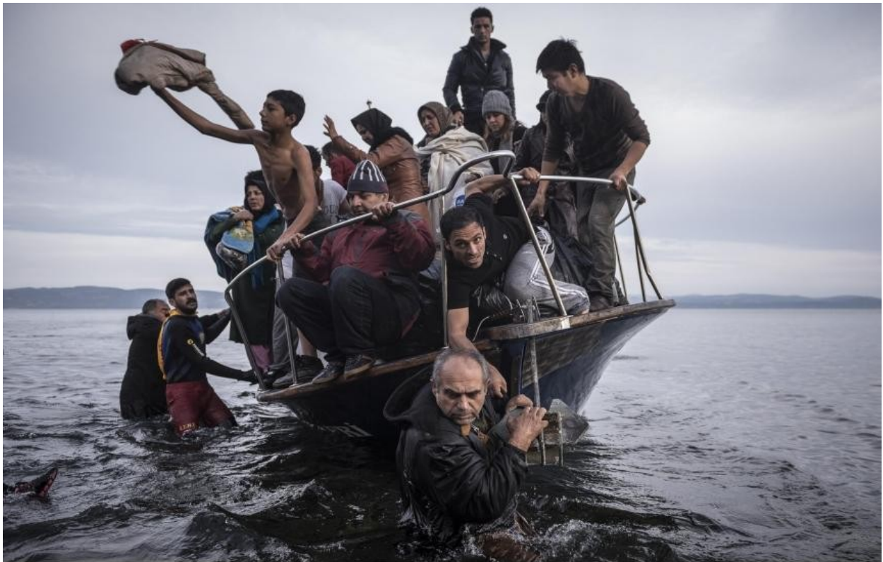
Ναυάγιο σκάφους με πρόσφυγες