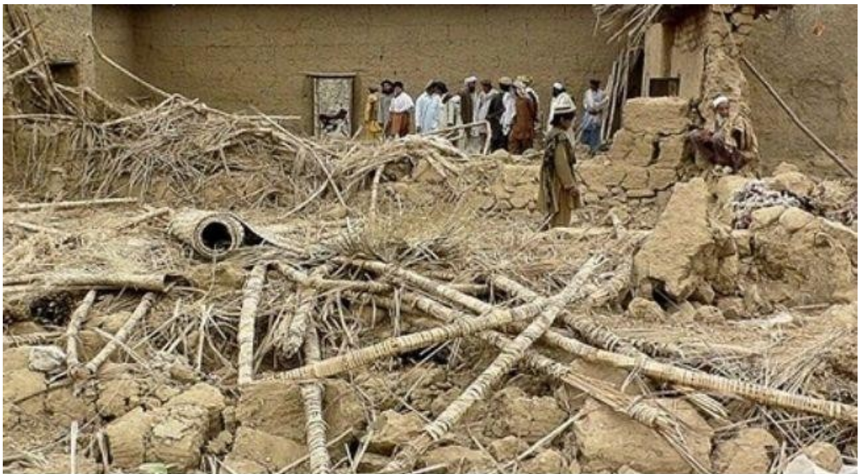
Αφγανιστάν : καταστροφή οικισμού έπειτα από επίθεση