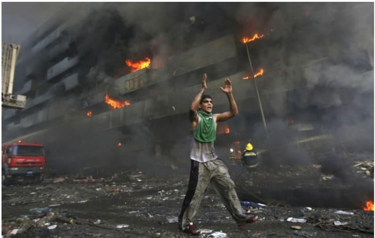
Βομβαρδισμός στο Ιράκ