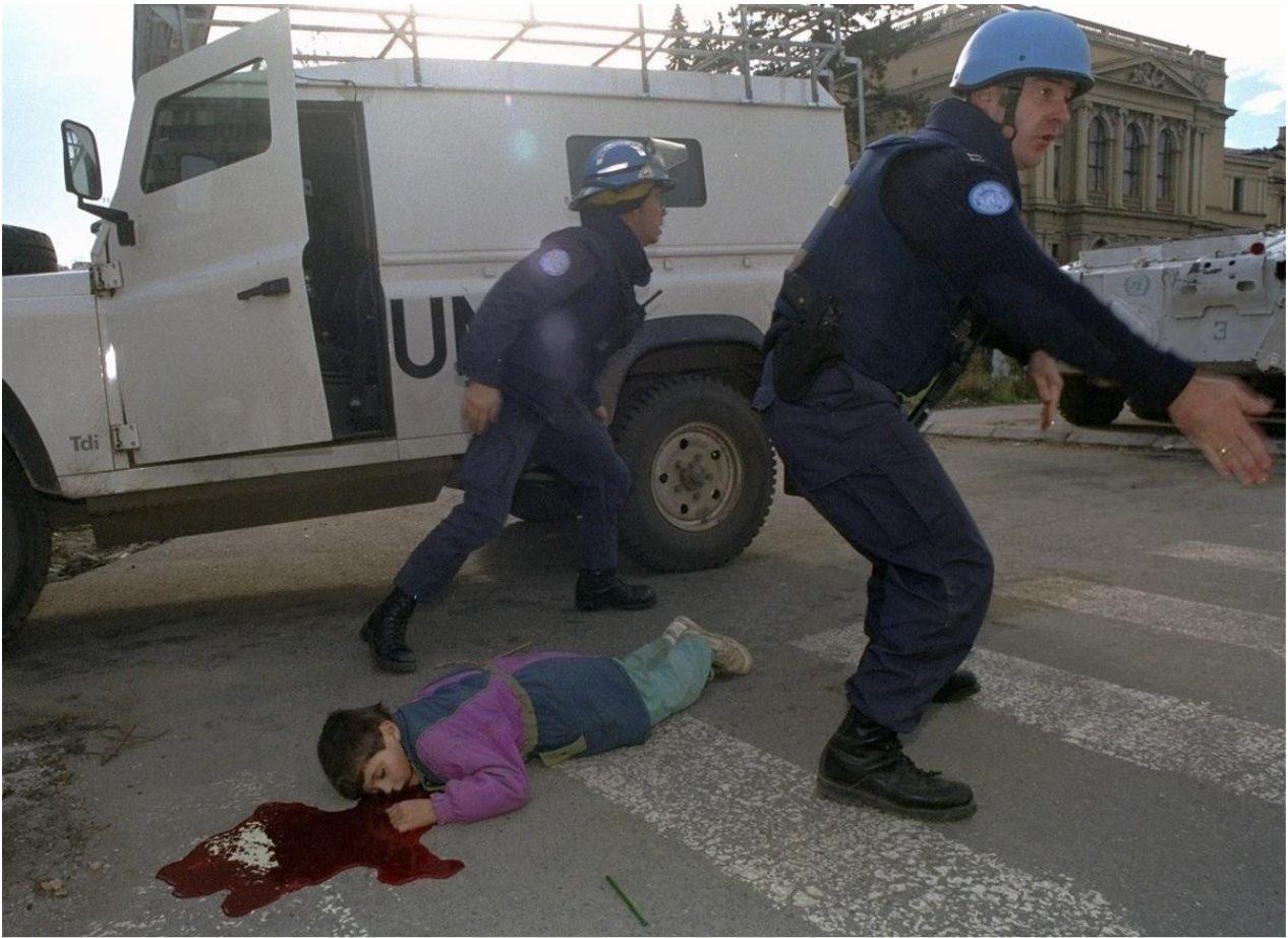
Γιουγκοσλαβία : παιδί πέφτει νεκρό πυροβολημένο στο κεφάλι από ελεύθερο σκοπευτή