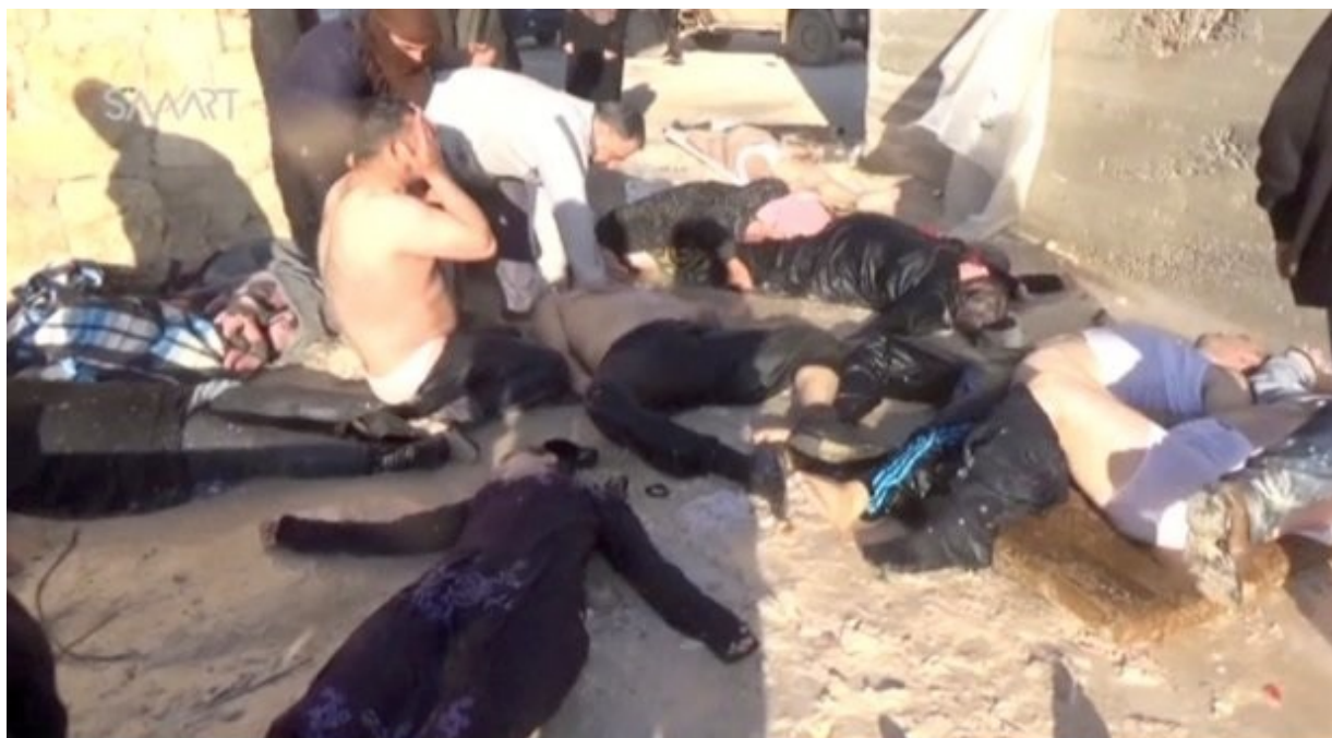
Συρία : θύματα επίθεσης με χημικά