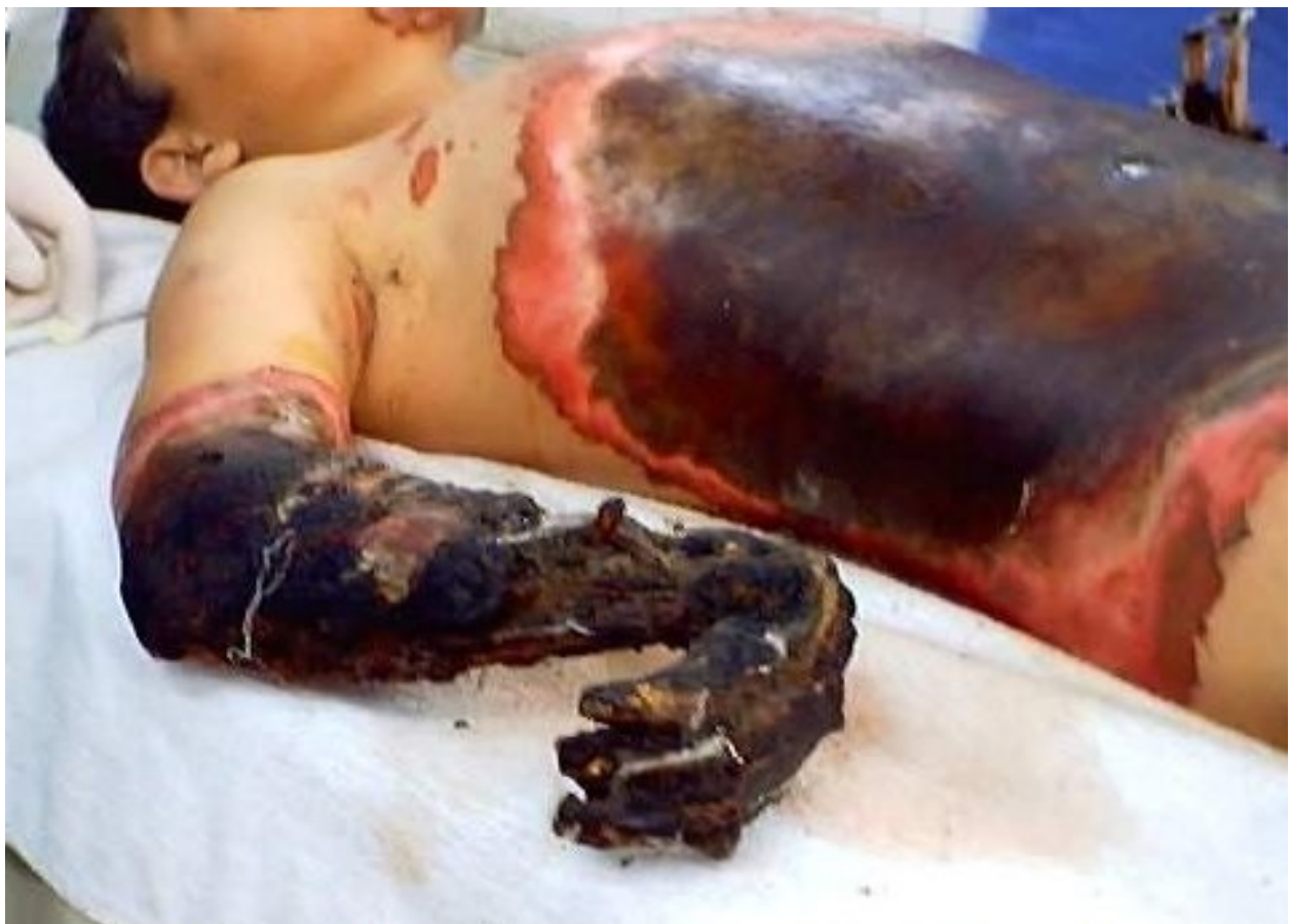
Ιράκ : θύμα των βομβαρδισμών