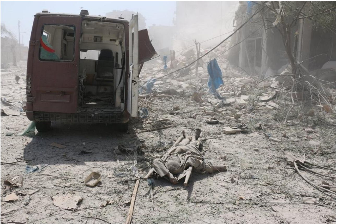
Συρία : αμέσως μετά από βομβαρδισμό