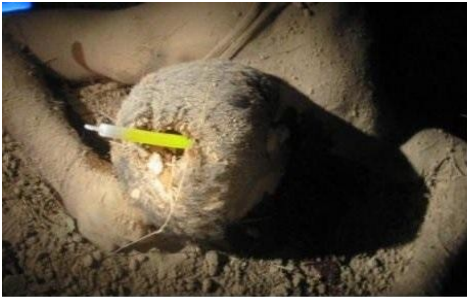
Ιράκ : νεκρός θαμμένος στα ερείπια μετά από βομβαρδισμό