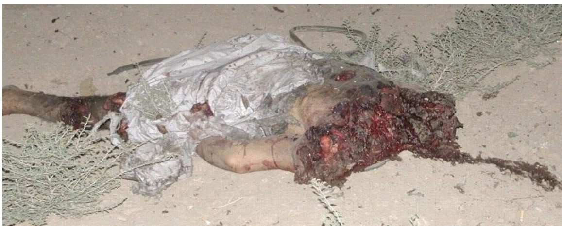
Πτώμα Ιρακινού, αποκεφαλισμένο έπειτα από έκρηξη