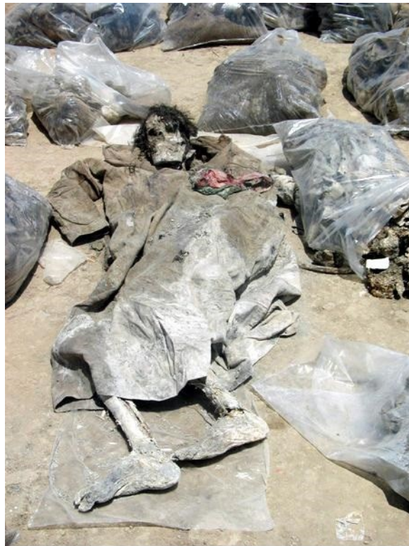
Ιράκ : θύματα των βομβών λευκού φωσφόρου