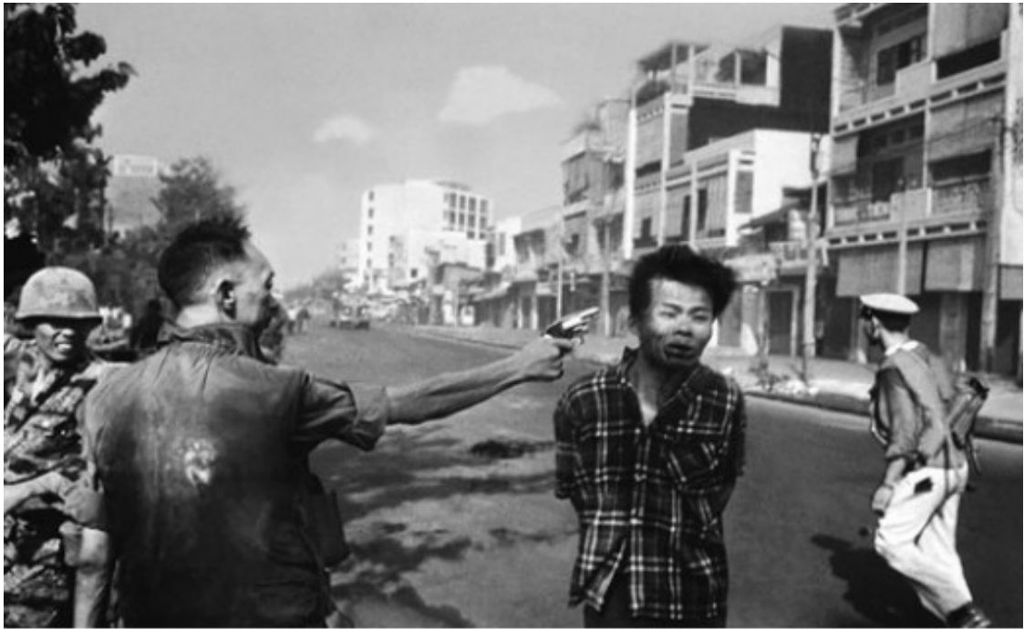
Βιετνάμ : αιχμάλωτος εκτελείται στη μέση του δρόμου