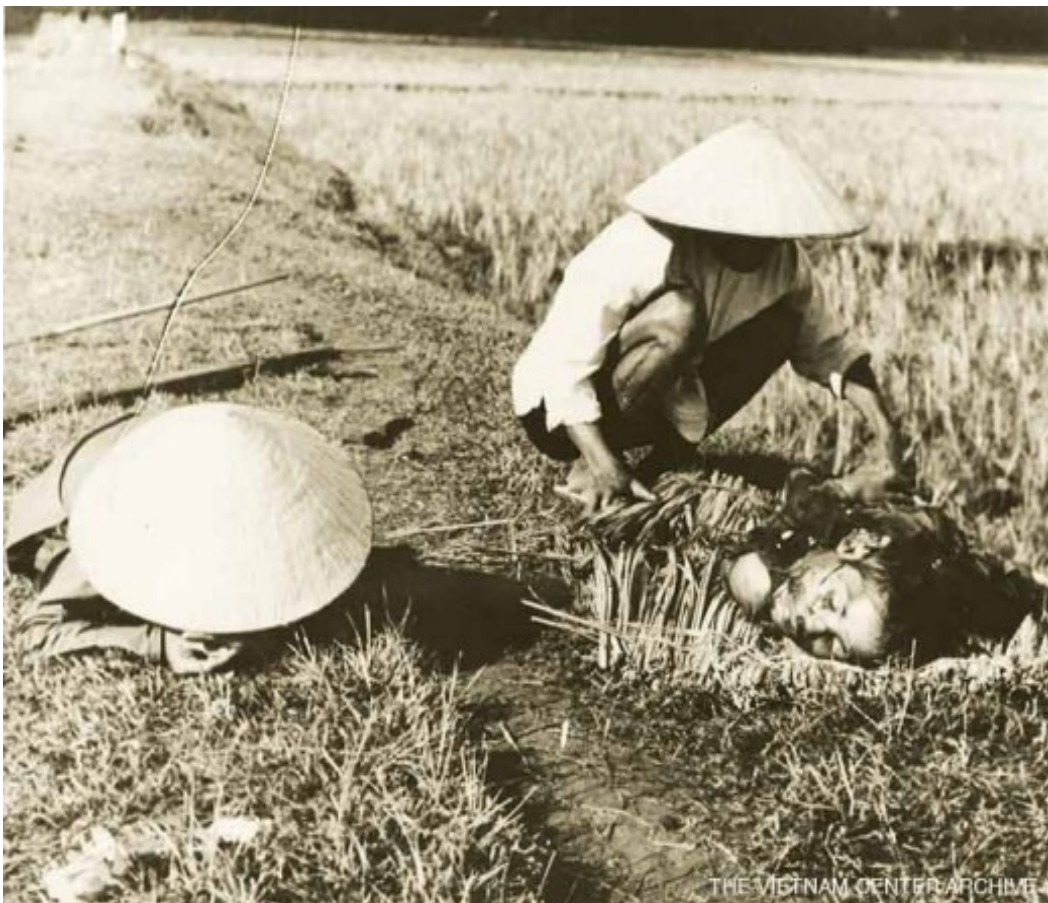
Βιετνάμ : άμαχοι θύματα του πολέμου