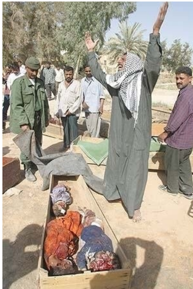
Ιράκ : κηδεία θυμάτων του πολέμου