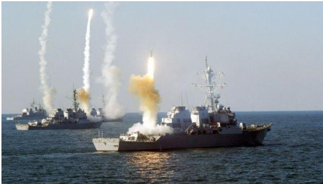
Πυραυλική επίθεση στη Συρία

Από που κι ως που είναι λειτούργημα ρε καραγκιόζηδες το να καταστρέφεις τις ζωές εκατομμυρίων ανθρώπων για να πλουτίζουν κι άλλο οι ολιγάρχες και να πουλάνε το εμπόρευμα τους οι πολεμικές βιομηχανίες; Αυτό δεν είναι λειτούργημα αλλά κακούργημα!