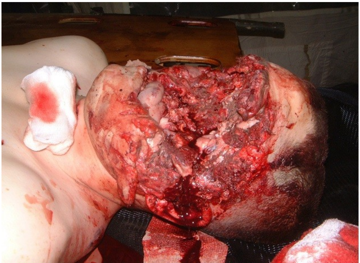
Ιράκ : νεκρός μισθοφόρος με το πρόσωπο να λείπει