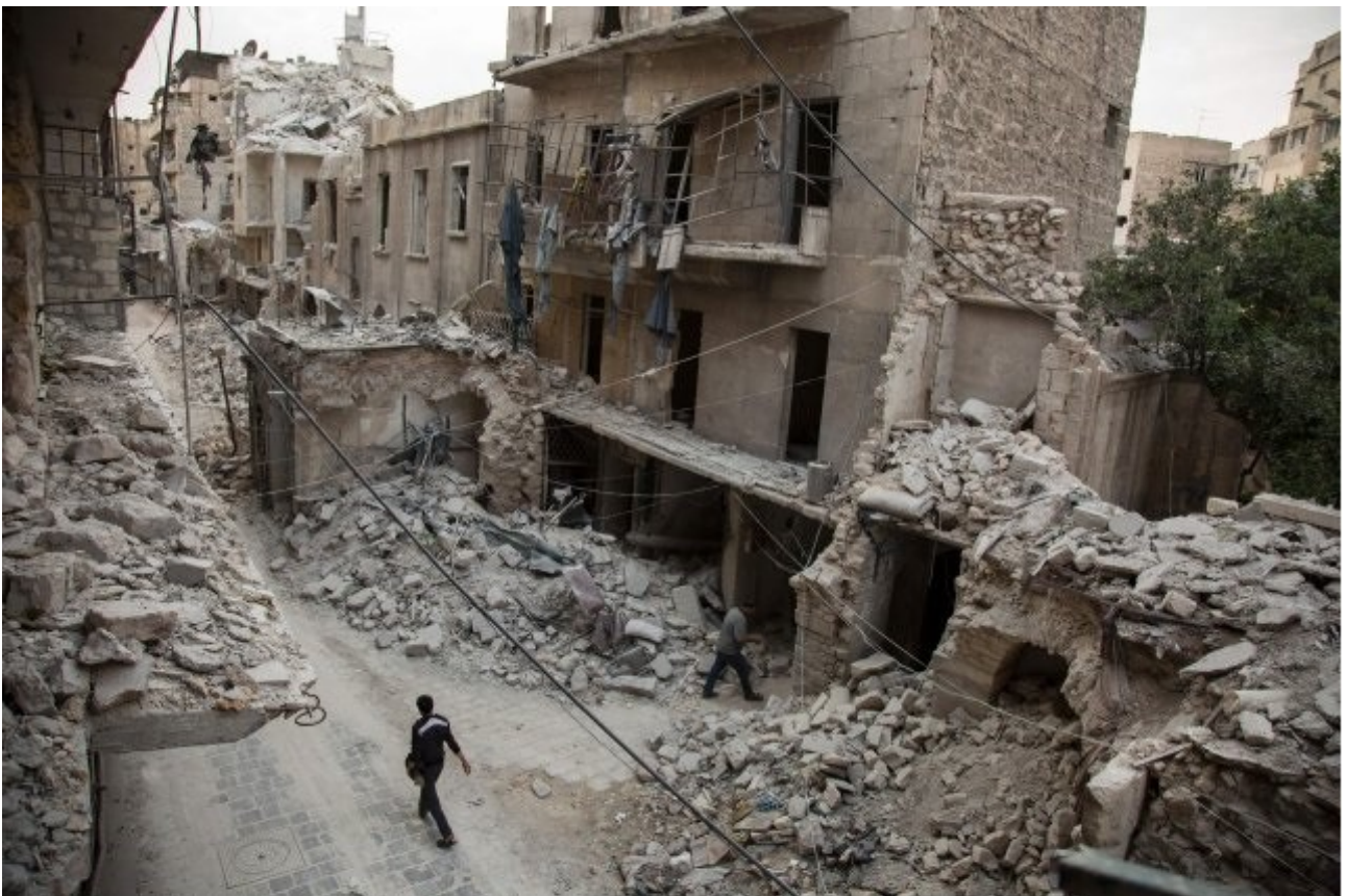
Συρία : το Χαλέπι μετά τους βομβαρδισμούς