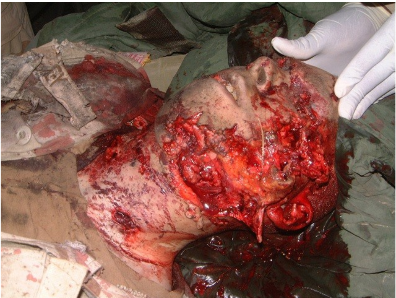
Ιράκ : σκοτωμένος μισθοφόρος