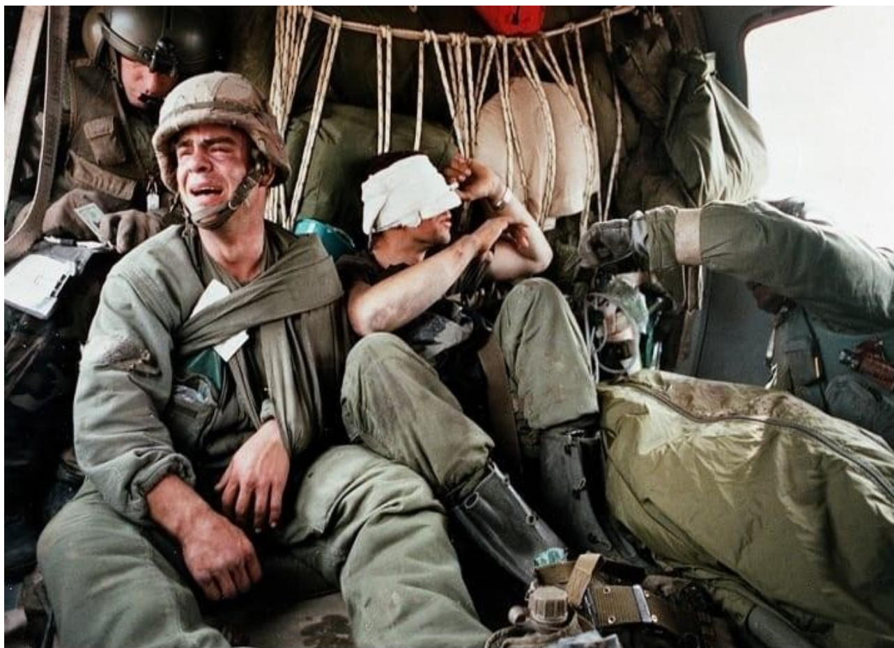
Πόλεμος του Κόλπου : Αμερικανοί πεζοναύτες αποχωρούν από το μέτωπο τραυματισμένοι

Ακόμα και αν είσαι τελείως αναισθητός και διεφθαρμένος, ικανός να διαπράττεις θηριωδίες χωρίς τύψεις προκειμένου να βγάλεις χρήματα σκέψου ότι αν ακολουθήσεις καριέρα στις ένοπλες δυνάμεις είναι πολύ πιθανό κάποια στιγμή να βρεθείς κι εσύ με τη σειρά σου στη θέση του θύματος. Και τότε θα δεις τη γλύκα!