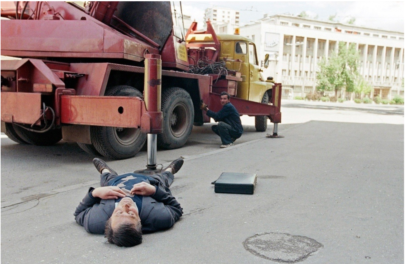
Γιουγκοσλαβία : θύμα ελεύθερου σκοπευτή