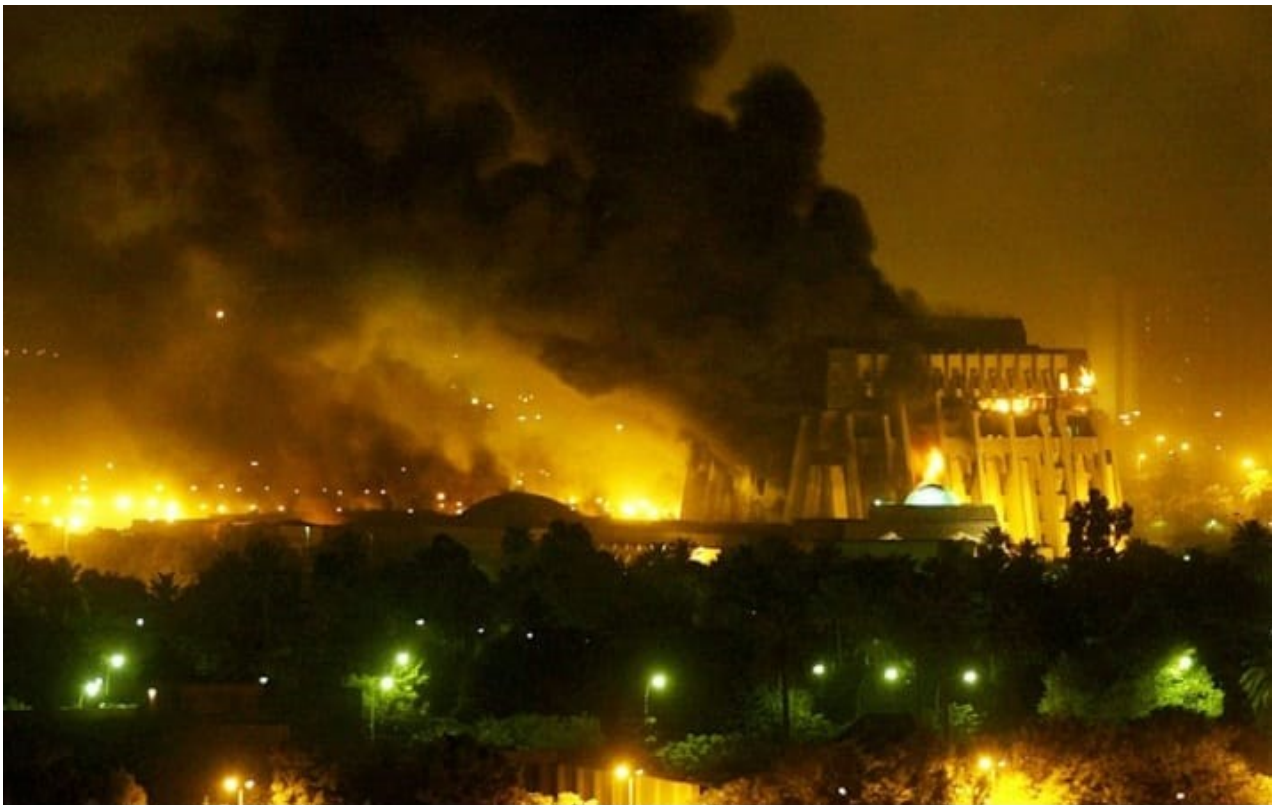
Ιράκ : ο βομβαρδισμός της Βαγδάτης