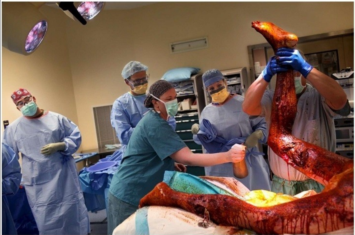
Μισθοφόρος στο Αφγανιστάν , με σοβαρά εγκαύματα στο χειρουργείο.