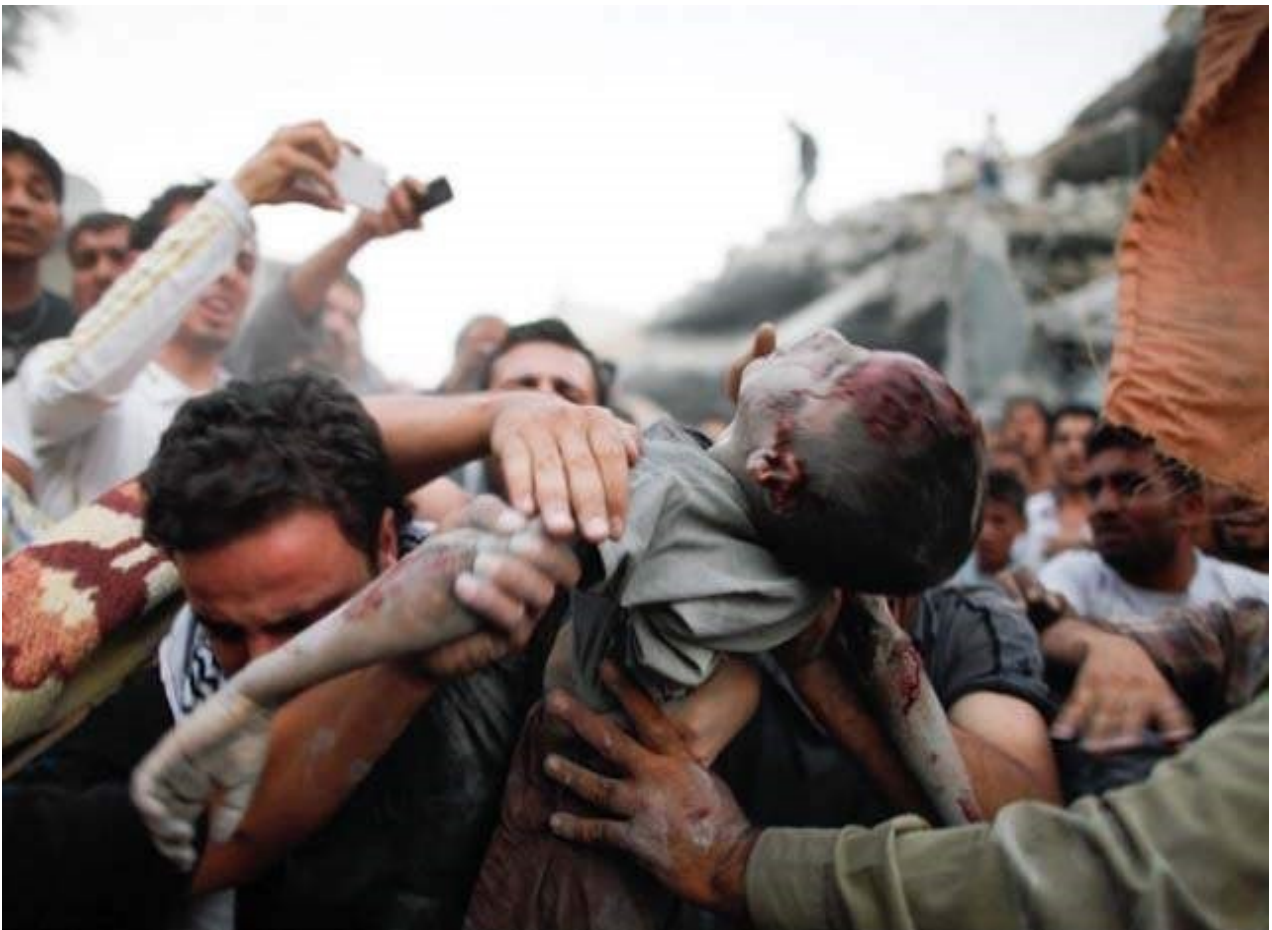
Συρία : θύμα των βομβαρδισμών