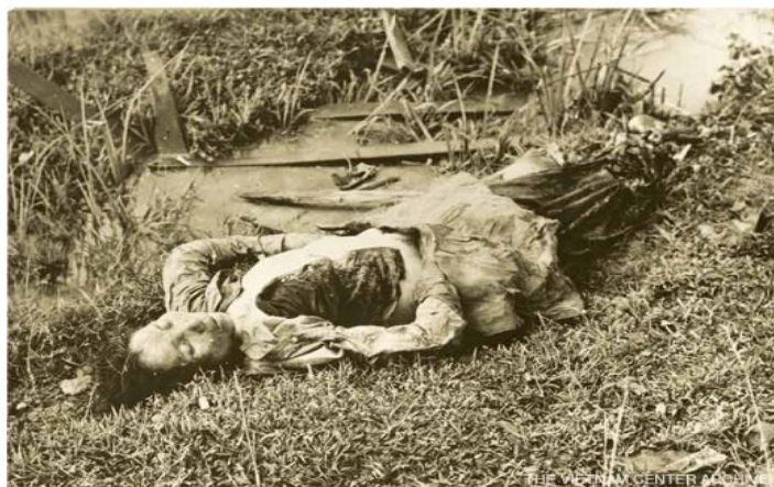
Βιετνάμ : άμαχοι θύματα του πολέμου

Θαυμάστε τη « δόξα » και το « μεγαλείο » του πολέμου! Όπως είναι στην πραγματικότητα και όχι όπως στα παραμύθια των μιλιταριστών. Το ζηλεύετε;