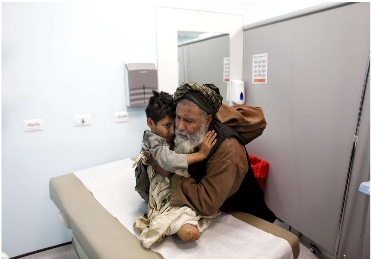
Αφγανιστάν : ακρωτηριασμένο παιδάκι