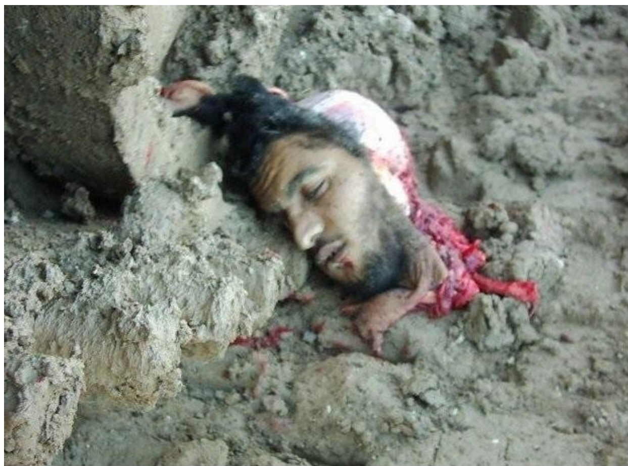
Κομμένο κεφάλι Ιρακινού έπειτα από έκρηξη