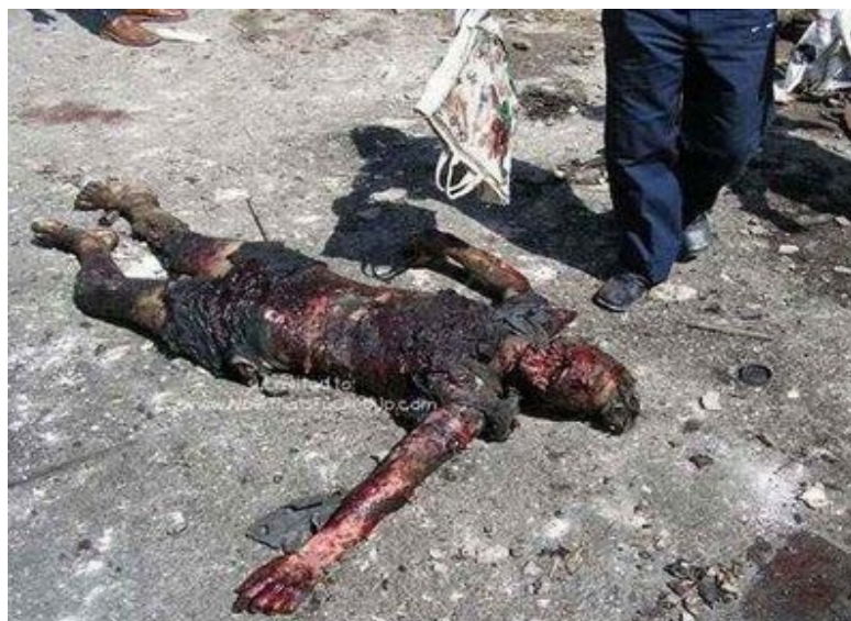
Ιράκ : θύμα εκρηκτικού μηχανισμού