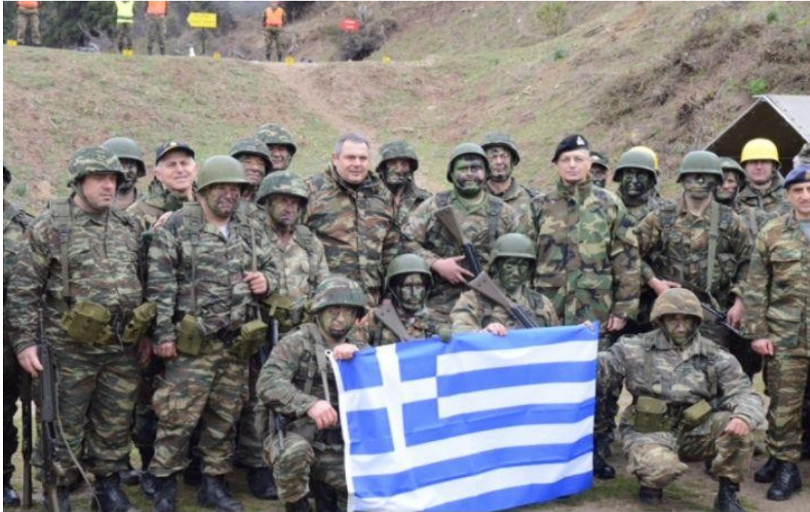
Αναμνηστική φωτογραφία με τον Π. Καμμένο

πραγματικής πολεμικής σύγκρουσης και την τύχη που τους περιμένει αν αναγκαστούν να πάρουν μέρος σ' αυτή. Βλέπουμε μέλη στρατιωτικών σωμάτων να πουλάνε μαγκιά σε καιρό ειρήνης, να είναι όλο πόζες και να κάνουν φιγούρα σε παρελάσεις και επιδείξεις για να δείξουν πόσο σκληρά αντράκια είναι και πόσο αξιόμαχοι.