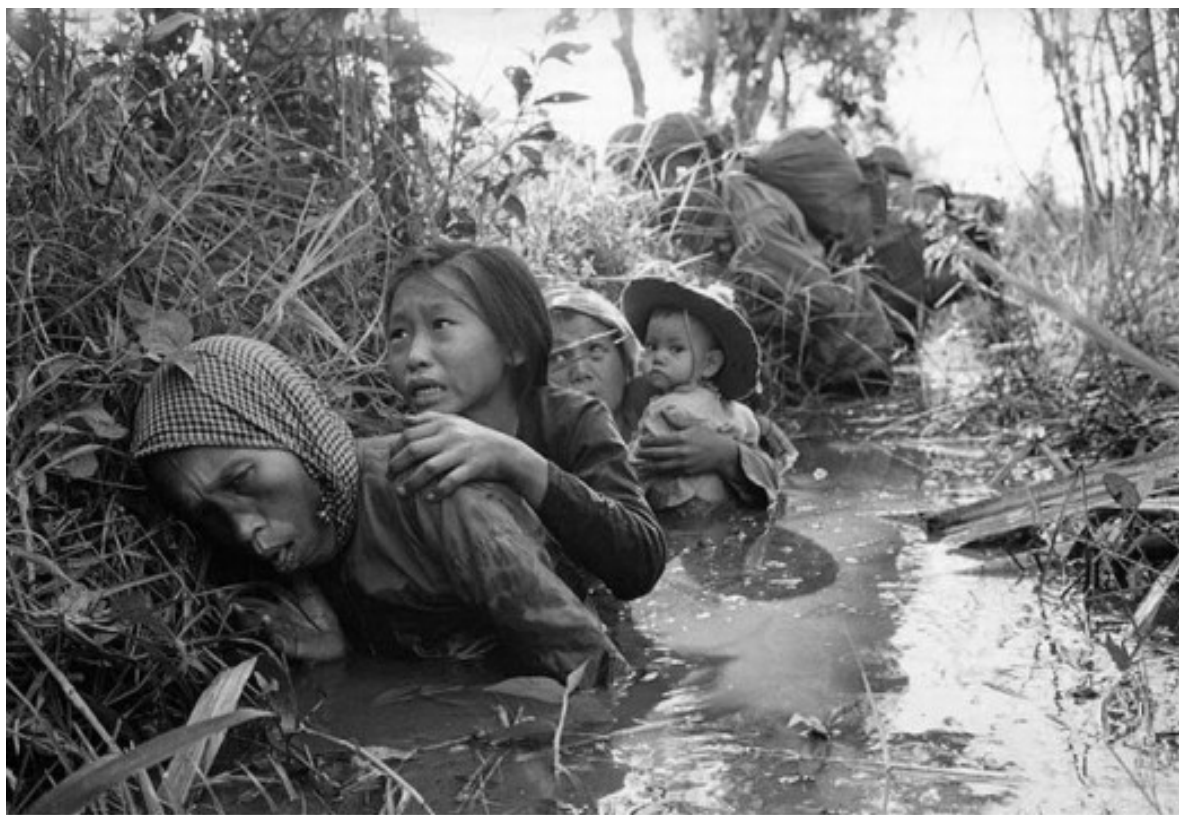
Βιετνάμ : άμαχοι κρύβονται για να σωθούν κατά τη διάρκεια επίθεσης