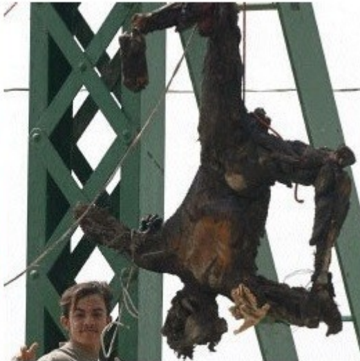
Ιράκ : απανθρακωμένο πτώμα μισθοφόρου