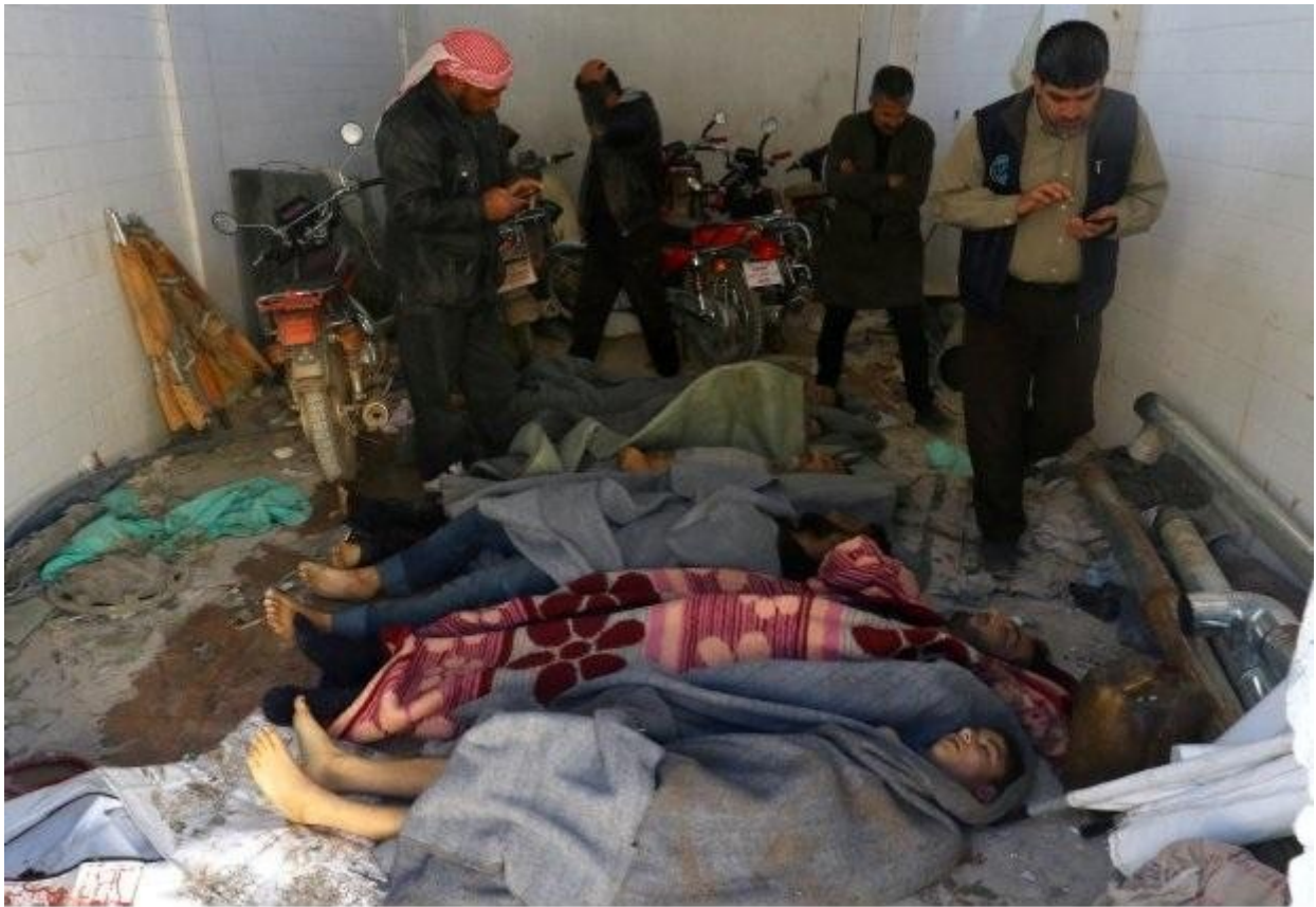
Συρία : νεκροί από επίθεση με χημικά