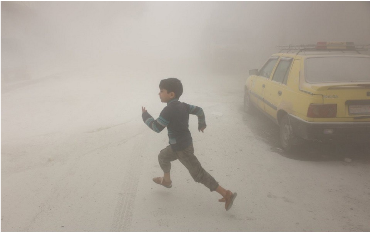
Συρία : παιδί τρέχει για να σωθεί κατά τη διάρκεια βομβαρδισμού