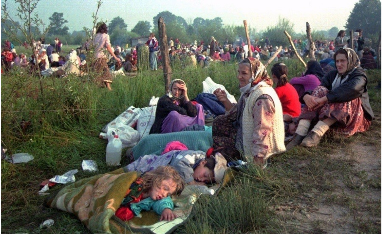
Γιουγκοσλαβία : πρόσφυγες εγκαταλείπουν τις εστίες τους

Τι το ηρωικό υπάρχει στο να εμποδίζεις τον κόσμο να εγκαταλείψει τις εστίες πολέμου ή να τον τιμωρείς σε περίπτωση που το πράξει με τουφεκισμούς και νάρκες στα χερσαία σύνορα, πνιγμούς στα θαλάσσια σύνορα και εγκλεισμό των επιζώντων σε στρατόπεδα συγκέντρωσης;