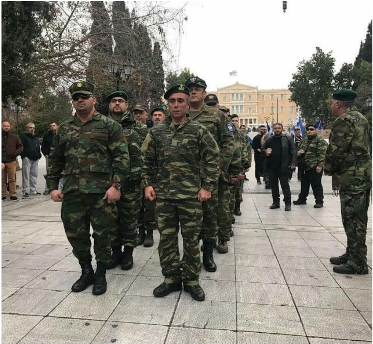
Στρατιωτικοί στο συλλαλητήριο για το Μακεδονικό