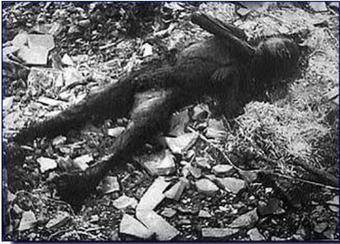
Βιετνάμ : θύμα βόμβας Ναπάλμ