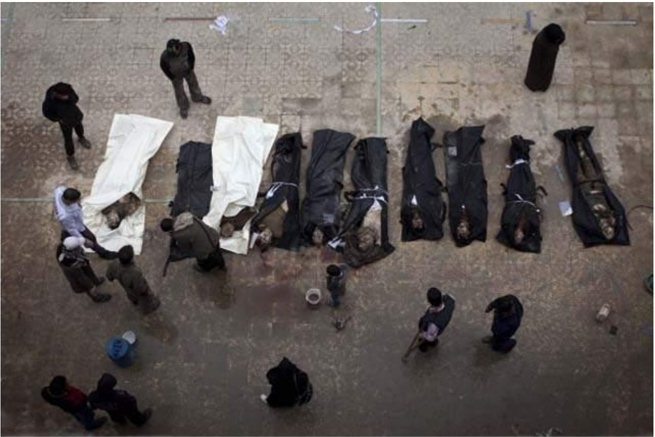
Συρία : θύματα ομαδικής εκτέλεσης