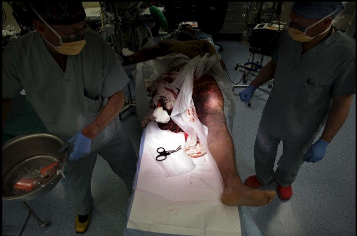
Στρατιώτης στο Αφγανιστάν υφίσταται ακρωτηριασμό στο πόδι.