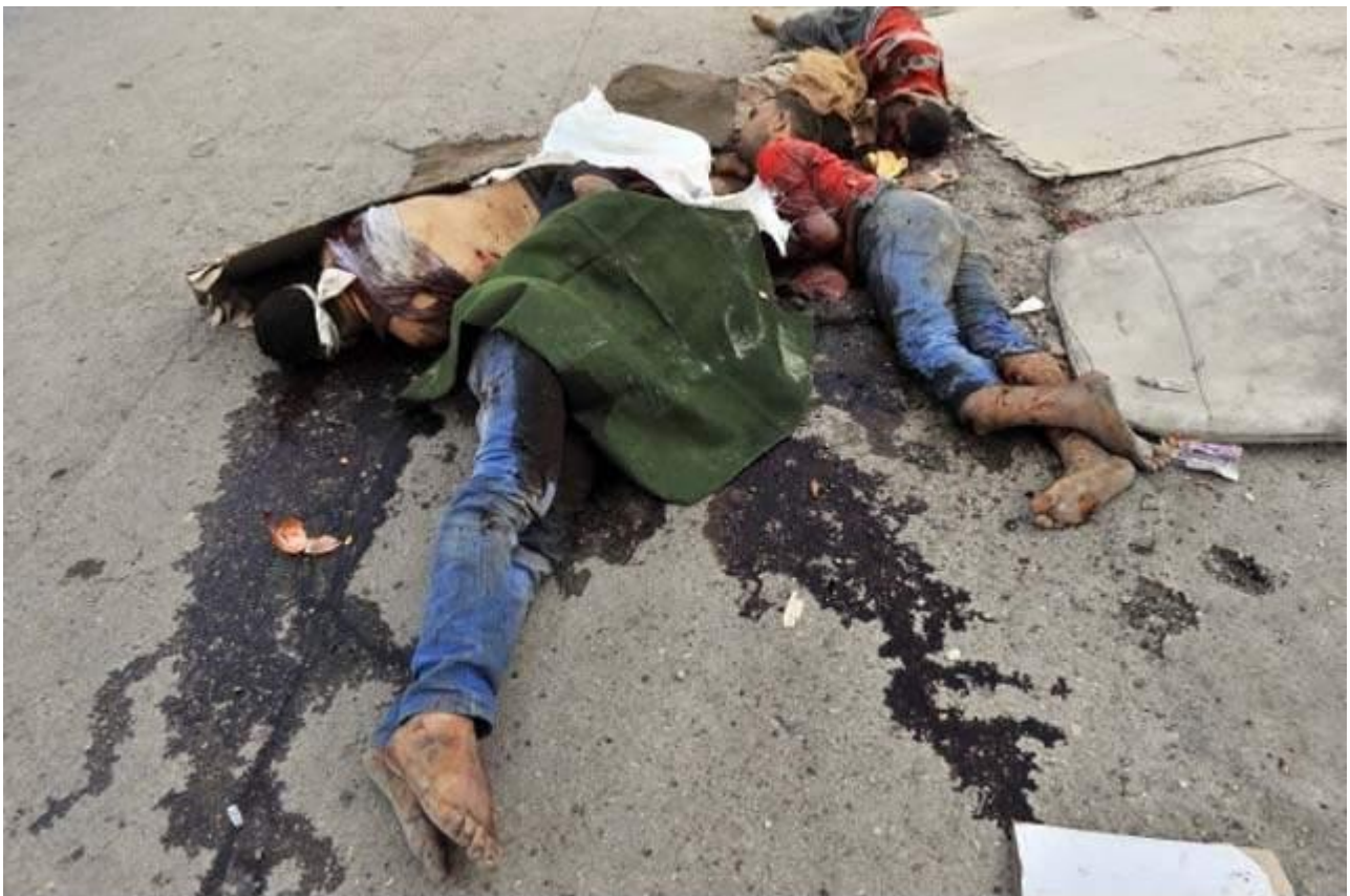
Συρία : πτώματα παρατημένα στο δρόμο