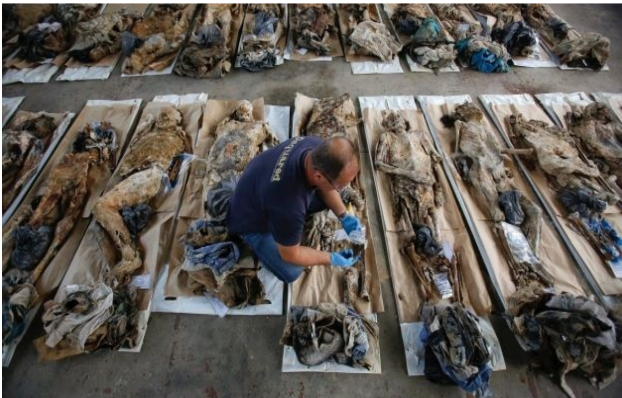
Βοσνία : το περιεχόμενο ενός ομαδικού τάφου