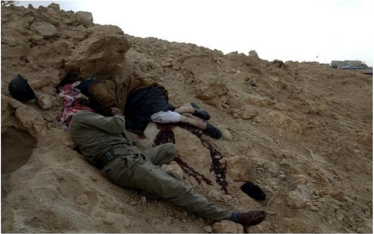
Ιράκ : θάνατος στο πεδίο της μάχης