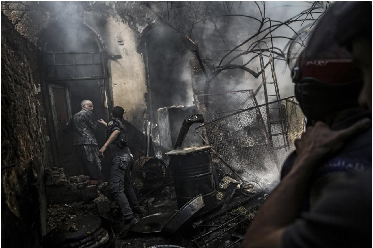
Συρία : αμέσως μετά από βομβαρδισμό