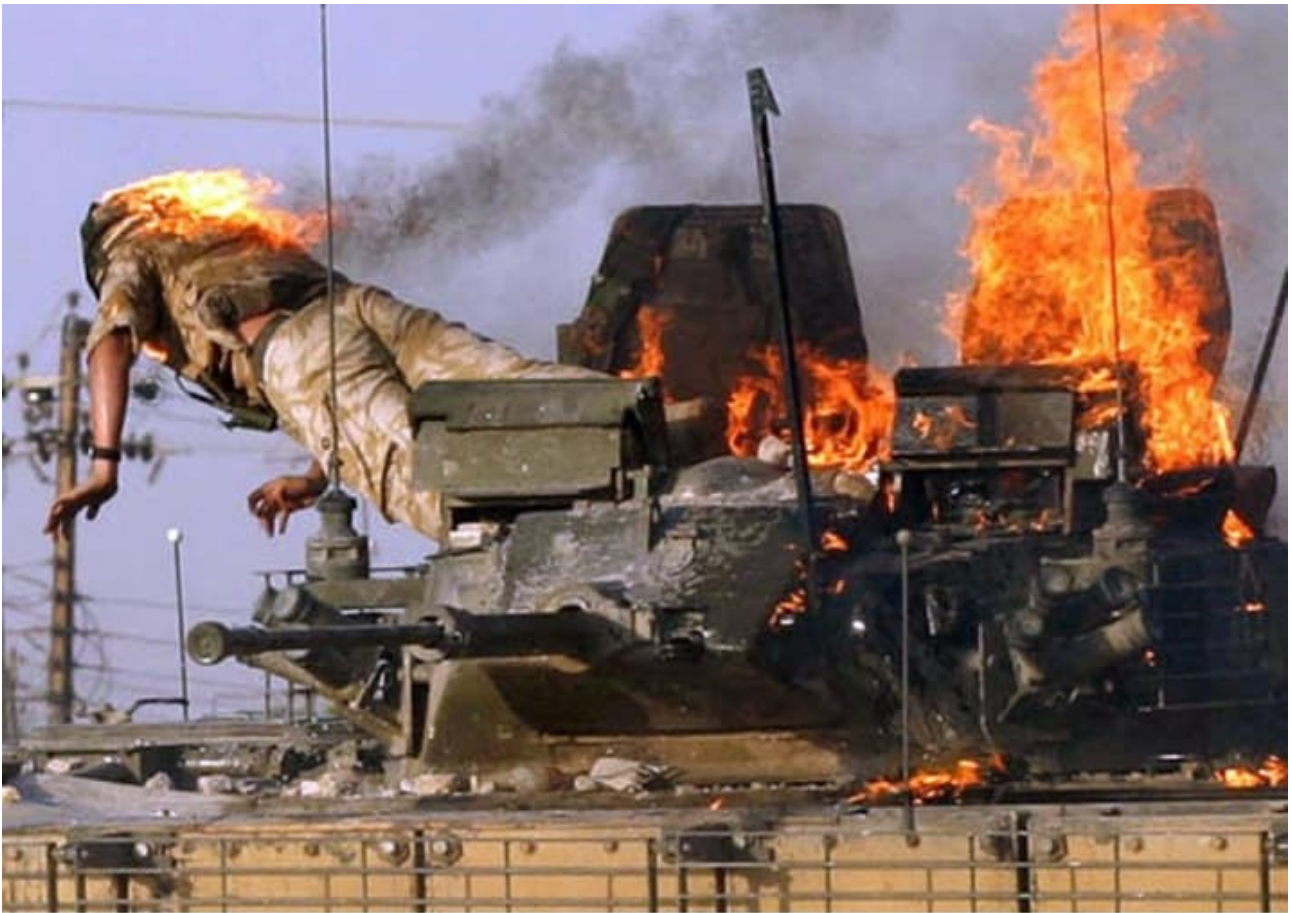
Ιράκ : στρατιώτες δέχονται επίθεση