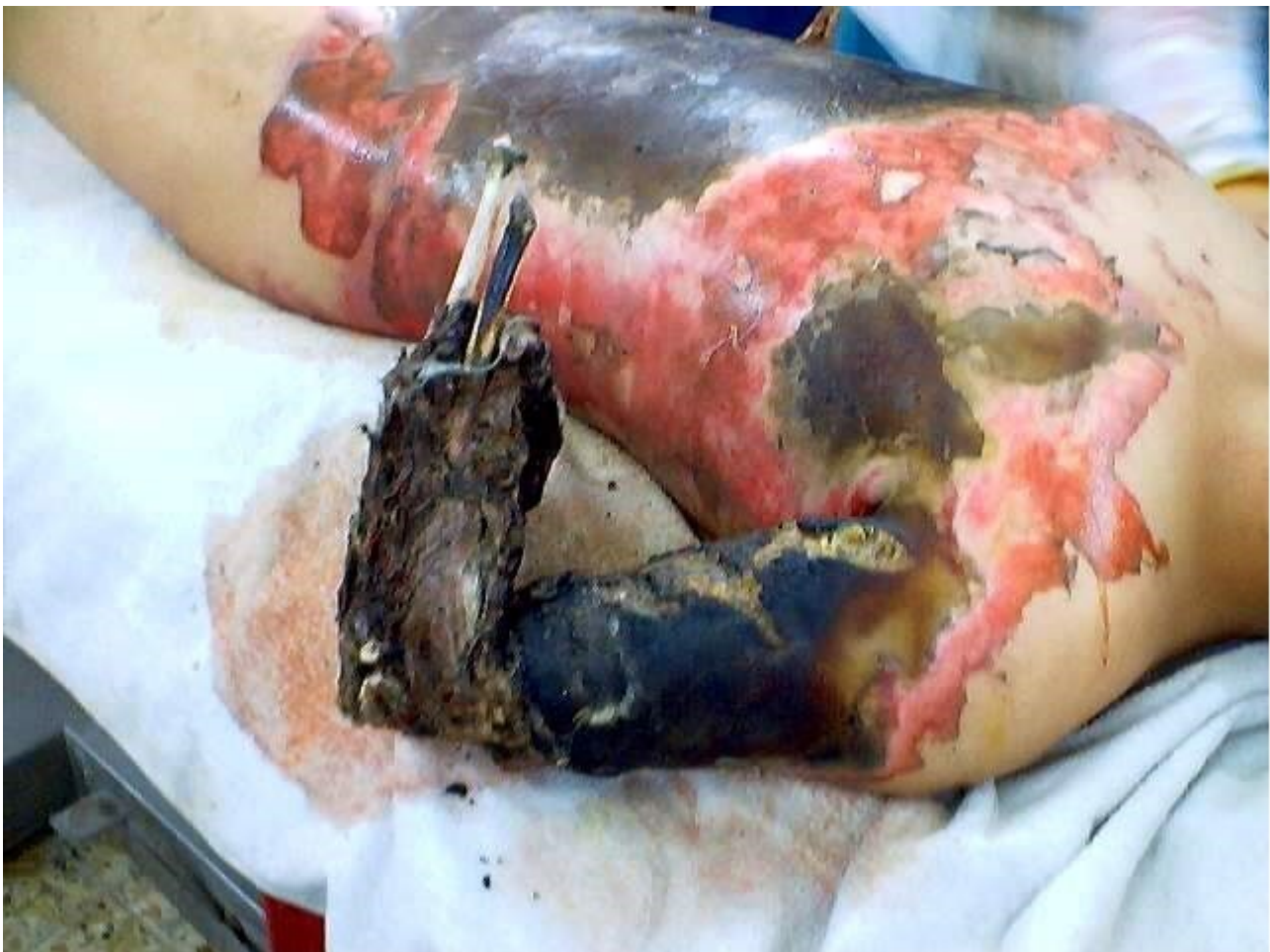
Ιράκ : θύμα των βομβαρδισμών