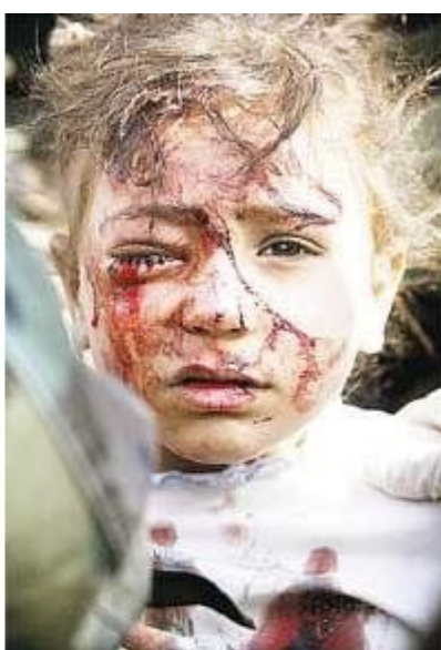
Ιράκ : τραυματισμένο παιδί